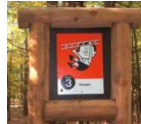
Übung 3 des Waldsportpfades

Auf dem 2,3 km langen Waldsportpfad werden neben dem Laufen diverse Fitnessübungen wie Hangeln oder Kriechen absolviert. Das bringt neben einer guten Ausdauer auch Muckis für Jugendliche und Erwachsene. Sowohl im Winter, als auch im Sommer, ist der Waldsportpfad einen Versuch wert.