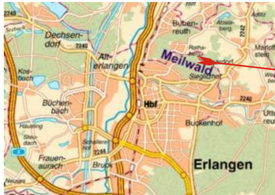
Karte von Erlangen mit Meilwald

Der Erlanger Meilwald ist es auch als Erlanger Stadtwald bekannt. Er liegt im nordöstlichen Teil des Stadtgebietes. Der Karte können Sie alle Einrichtungen, Einrichtungen und die wichtigen Pfade des Meilwaldes entnehmen.