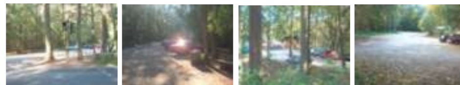
Für Autofahrer sind Parkmöglichkeiten vorhanden.

Bei fachlichen Fragen zur Waldbewirtschaftung wenden Sie sich bitte an das Amt für Landwirtschaft und Forsten Fürth, Bereichsstelle Erlangen, Telefon 09131-88 49 0.