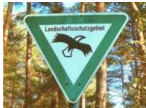
Schild vor dem Meilwald

Wo die Flugsanddecke (jüngste geologische Ablagelagerung) dünner ist, befinden sich wechselfeuchte bis mäBig feuchte Böden. Zwei kleine Bäche entwässern den Meilwald nach Süden; in ihren Auen steht das Grundwasser hoch an, so dass hier nasse bis sehr nasse Böden ausgebildet sind.