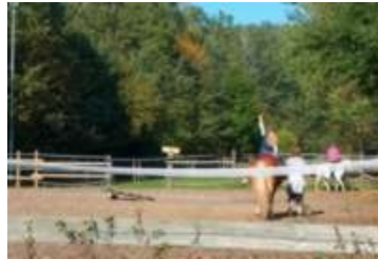
Der Reitplatz der Jugendfarm

Neben seiner vielfältigen Ökologie bietet der Meilwald verschiedene Möglichkeiten die Freizeit zu gestalten. Speziell für Kinder und Jugendliche zwischen 6 und ca. 16 Jahren gibt es die Jugendfarm. Sie bietet vorrangig "Offene Kinder- und Jugendarbeit an, d. h. Alle können kommen, wenn sie Lust haben.