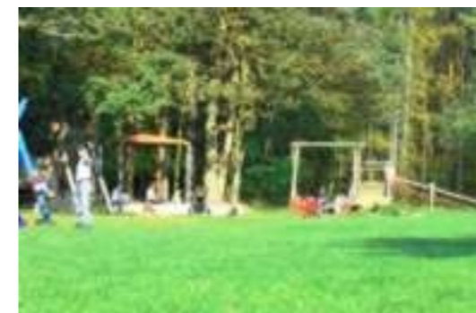
Blick auf den Spielplatz

Selbstverständlich können Sie auch alle anderen Wege für Ihre sportlichen Tätigkeiten nutzen.