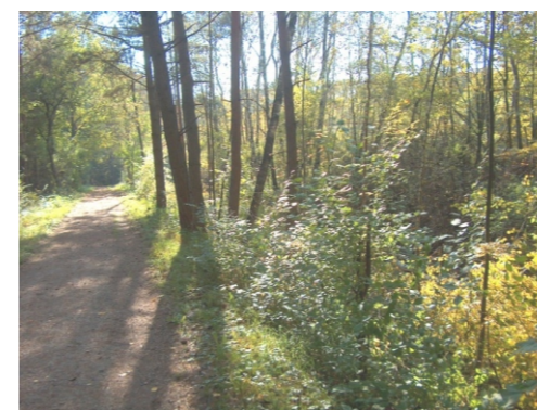
Laubbäume im Meilwald

Wegen seiner Standortvielfalt und dem hohen Mischwaldanteil zählt Meilwald zu den wertvollsten Waldgebieten im Erlanger Stadtgebiet. Die großen Waldflächen dienen als Frisch- und Kaltluftentstehungsgebiete; die Frischluftzufuhr ist wichtig für das Erlanger Stadtzentrum.