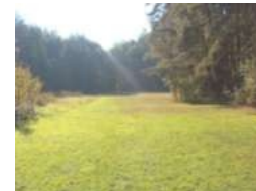
Lichtung bei Bolz- und Spielplatz

Die Übergangsbereiche zwischen Kiefernforst und angrenzenden offenen Flächen stellen einen wertvollen Trockenstandort dar. Auf nährstoffarmen, trockenen Böden am Waldrand kommen hier charakteristische Arten sandiger Rohbodenstandorte wie der Ameisenlöwe oder der Bienenwolf vor.