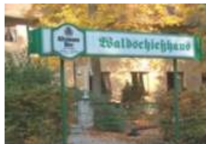
Eingang des Walschießhauses

Abenteuer- und Erlebnispädagogik und Psychomotorik eingesetzt. Die Angebote der Jugendfarm sind größtenteils kostenfrei. Öffnungszeiten, Programm und weitere Informationen gibt es auf ihrer Internetseite "Www.jugendfarm-er.de".