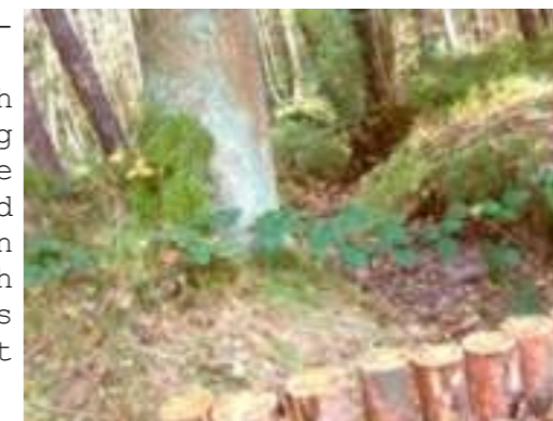
trockener Bachlauf im Meilwald

Wo die Flugsanddecke (jüngste geologische Ablagelagerung) dünner ist, befinden sich wechselfeuchte bis mäBig feuchte Böden. Zwei kleine Bäche entwässern den Meilwald nach Süden; in ihren Auen steht das Grundwasser hoch an, so dass hier nasse bis sehr nasse Böden ausgebildet sind.