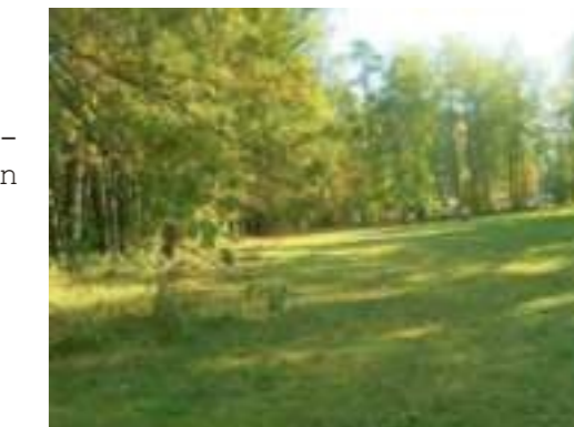
Lichtung an der Langen Zeile

Dieser Waldrand hat eine große Bedeutung für wärmeliebende Insekten, wie Feldheuschrecken und Libellen. Manche treten sogar in großer Zahl auf, sie sind aber ganz harmlos, so dass man wahrscheinlich sagen kann: Diese Wiese ist ein springlebendiger Lebensraum.