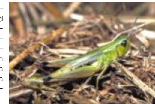
Sumpfgrashüpfer von Ulrich Rau

Auf der Lichtung des ehemaligen Schießplatzes und den Schießbahnen entwickeln sich halbtrockenrasenartige Säume und Magerrasen mit dem einzigen Vorkommen des seltenen Wiesenknopfbläulings in Erlangen und einer artenreichen Heuschreckenfauna.